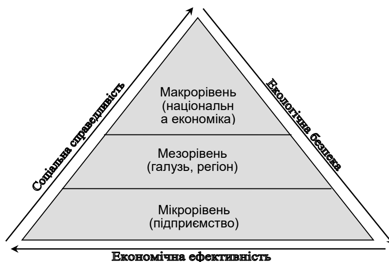
Рис. 1. Рівні забезпечення сталого розвитку

У Стратегії сталого розвитку «Україна – 2020», схваленої Указом Президента України у 2015 році, серед основних пунктів реалізації даної стратегії визначено вектор розвитку, під яким вбачається забезпечення сталого розвитку держави, що повинно базуватися на макроекономічній стабільності, стійкому зростанні економіки екологічно невиснажливим способом, сприятливих умовах для ведення господарської діяльності [16]. У зазначеному пункті основний наголос зроблено на забезпеченні сталого розвитку, під яким загально визнано розуміють процес змін системи з метою забезпечення її життєздатності у майбутньому без завдання шкоди навколишньому середовищу, що базується на раціональному використанні природних ресурсів та зменшенні викидів шкідливих речовин, утворених у результаті господарської діяльності. Очевидно, що досягнення поставленого завдання вимагає системного розгляду концепції сталого розвитку. Ми пропонуємо здійснити це у трирівневій площині (рис. 1): підприємство – галузь, регіон – національна економіка.