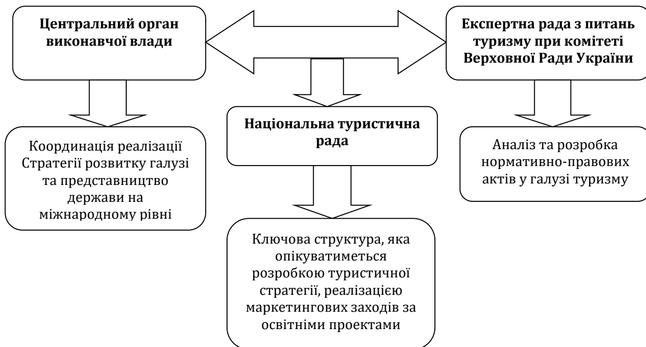
Рис. 2. Модель державного управління у галузі туризму

Першими етапами на шляху удосконалення чинної моделі державного управління в галузі туризму в Україні повинні стати створення Національної туристичної ради, спеціалізованого центрального органу виконавчої ради (самостійного або в складі Міністерства економічного розвитку і торгівлі України), який буде займатися формуванням та реалізацією стратегії розвитку туризму й державної політики в сфері туризму, та Експертної ради з питань туризму при комітеті Верховної Ради України (рис. 2).