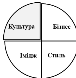
Рис. 3. Біхевіористична школа управління фірмовим стилем організації