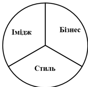
Рис. 2. Стратегічна школа управління фірмовим стилем організації

Основними фігурами в розвитку поняття фірмового стилю були Бернштейн, Балмер, Кеннеді та інші. За період 1950 року до нашого часу фірмовий стиль став невід'ємною частиною діяльності у будь-якій сфері бізнесу та зміцнив позиції в менеджменті, з'являється велика кількість дисциплін пов'язаних із дизайном та фірмовим стилем. У цей період виникає чотири основних теоретичних підходи (рис. 2 – 5), кожен з яких розкриває один з аспектів загального управління фірмовим стилем.