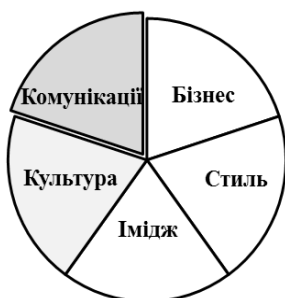
Рис. 4. Школа загальних комунікацій управління фірмовим стилем організації