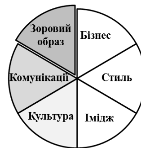
Рис. 5. Візуальна школа управління фірмовим стилем організації