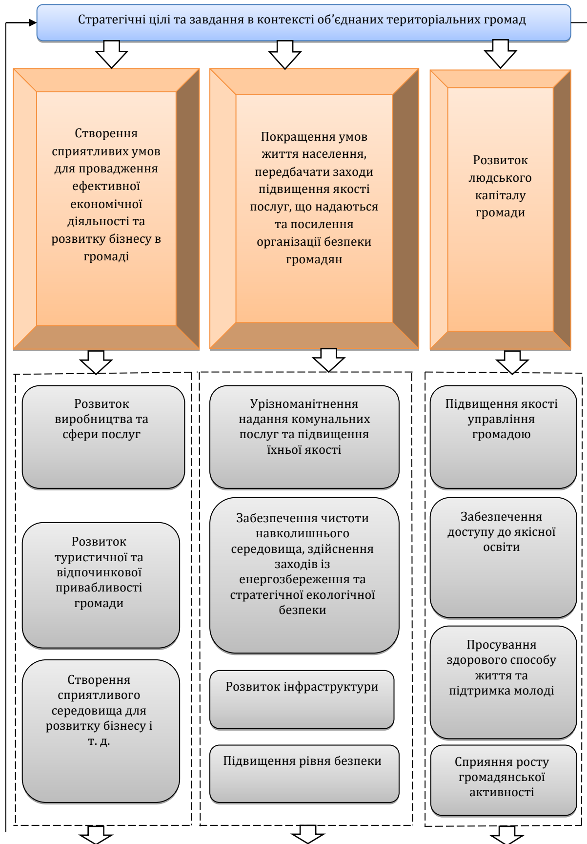
Рис. 2. Алгоритм формування конкурентоспроможної територіальної громади