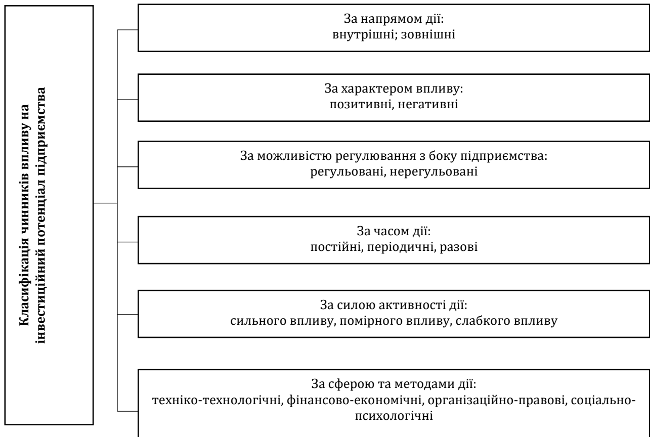
Рис. 1. Класифікація чинників впливу на інвестиційний потенціал підприємства

може бути реалізоване шляхом вдосконалення бізнесової діяльності підприємства незалежно від стану зовнішньої кон'юнктури. При такій ситуації наявні інвестиційні можливості здатні бути реалізовані достатньо швидко, а інвестиційний потенціал переважно помірний. Якщо ж спостерігається переважання зовнішніх негативних факторів, а внутрішні при цьому залишаються сприятливими, то для реалізації інвестиційного потенціалу необхідно здійснювати покращення інвестиційного клімату, проте інвестиції будуть відзначатися високим рівнем ризику. У випадку, якщо формування інвестиційного потенціалу підприємств здійснюється в умовах негативних внутрішніх та несприятливих зовнішніх чинників, то хоча інвестиційний потенціал і може складати значну величину, але капіталовкладення є дуже ризикованими, що може змусити контрагентів намагатися утримуватися від інвестування [5-7].