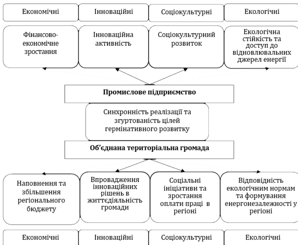
Рис. 1. Синхронність реалізації та згуртованість загальних цілей гермінативного розвитку в контексті взаємодії промислового підприємства та об'єднаної територіальної громади

Основні цілі гермінативного розвитку слід розподілити у відповідності до сімнадцяти загально визначених цілей сталого розвитку, які повинні бути досягнуті до 2030 році. Дані цілі орієнтовані на активізацію взаємопов'язаних елементів сталого розвитку в контексті побудови системи «промислове підприємство – об'єднана територіальна громада» і містять фінансове забезпечення та економічне зростання, інноваційну активність, соціальне інтегрування та охорона навколишнього середовища. Синхронність реалізації та згуртованість загальних цілей гермінативного розвитку відобразимо на рис. 1.