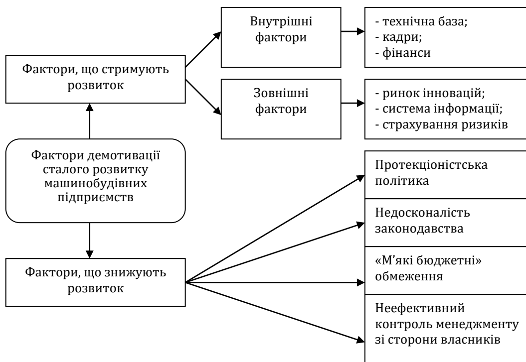
Рисунок 3. Фактори демотивації у механізмі сталого розвитку машинобудівних підприємств