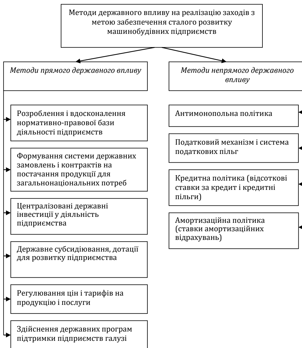
Рисунок 1. Методи державного впливу на реалізацію заходів з метою забезпечення сталого розвитку машинобудівних підприємств

На рис. 1 відображено систематизацію методів державного впливу на реалізацію заходів з метою забезпечення сталого розвитку машинобудівних підприємств.