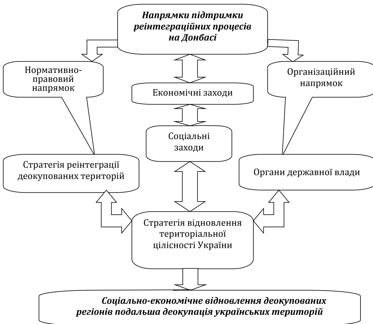
Рис. 2. Напрямки підтримки реінтеграційних процесів на Донбасі

Тривалі бойові дії призвели до значних людських жертв, спустошили міста і села, спричинили масові хвилі територіального переміщення населення як внутрішнього, так і за кордони країни. Кількість внутрішньо переміщених осіб зростала практично рівномірно, крім стрибків у період ускладнення воєнних дій, а саме грудень 2014 - лютий 2015 рр., коли кількість ВПО зросла на 493 902 осіб. Середньомісячна кількість переміщених із зони проведення антитерористичної операції осіб за даний період складає 10 000 осіб [18].