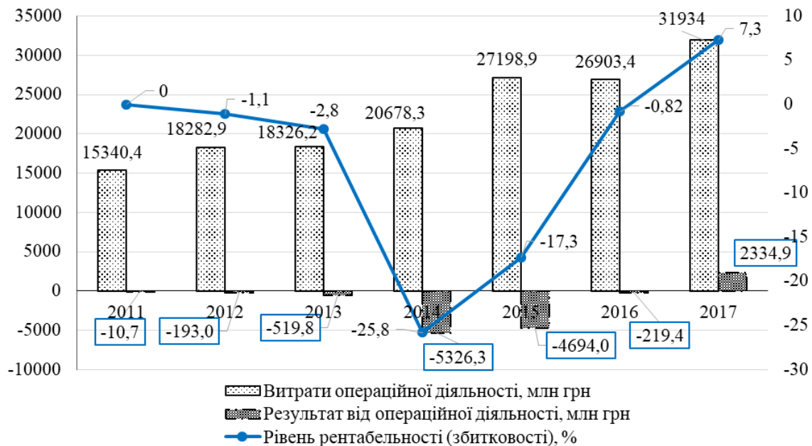
Рис. 2. Рентабельність операційної діяльності підприємств тимчасового розміщування й організації харчування у 2011–2017 рр.

Відповідно, операційна діяльність підприємств тимчасового розміщування й організації харчування у 2011–2016 рр. була нерентабельною, найбільший рівень збитковості припав на 2014 рік – 25,8 % (рис. 2).