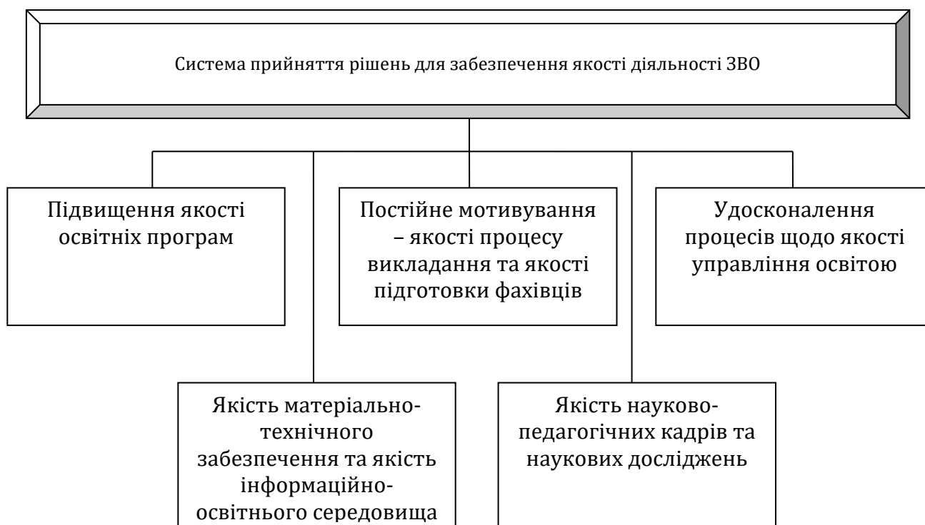
Рис. 2. Базові складові системи прийняття рішень для забезпечення якості діяльності ЗВО