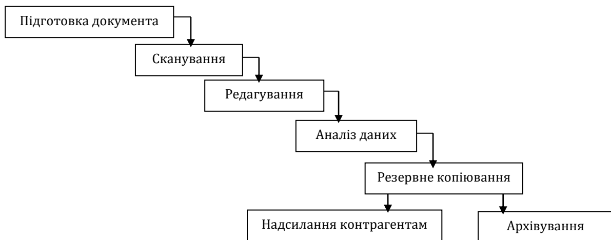
Рис. 3. Схема діджиталізації документообігу на підприємстві

У цілому схему діджиталізації документообігу можна відобразити наступним чином (рис. 3).