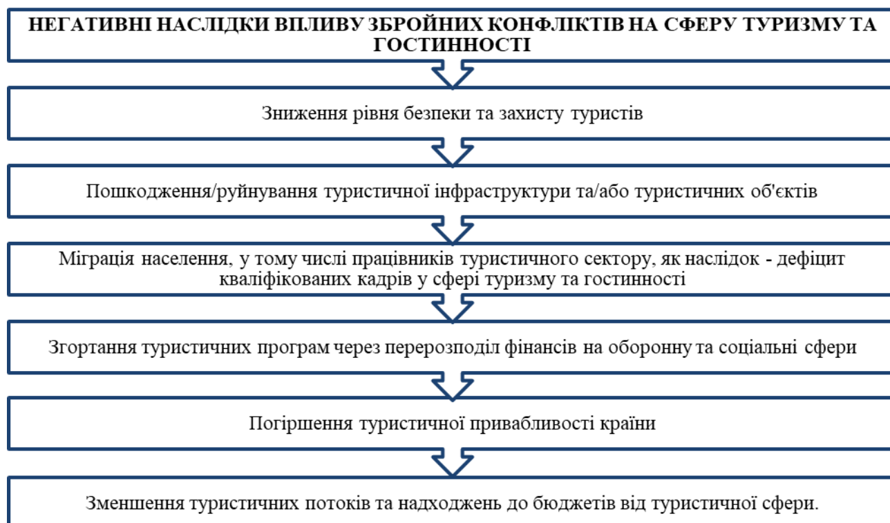
Рис. 1. Негативні наслідки впливу збройних конфліктів на сферу туризму та гостинності

Але будь-які військові та політичні загострення становлять серйозну проблему для розвитку туризму. Туризм – міжнародна галузь, яка останнім часом все більше потерпає від терористичних актів і збройних конфліктів (атаки в аеропортах, готелях, громадському транспорті тощо) [1]. У випадку серйозних військово-політичних загроз індустрія туризму не може існувати доти, поки не припиняться ці безладдя. В цілому можливо виокремити наступні негативні наслідки впливу збройних конфліктів на сферу туризму та гостинності (рис. 1).