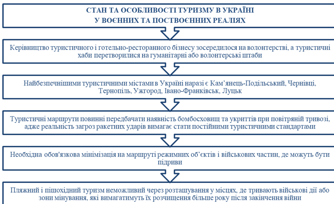
Рис. 3. Стан та особливості туризму в Україні у воєнних та поствоєнних реаліях