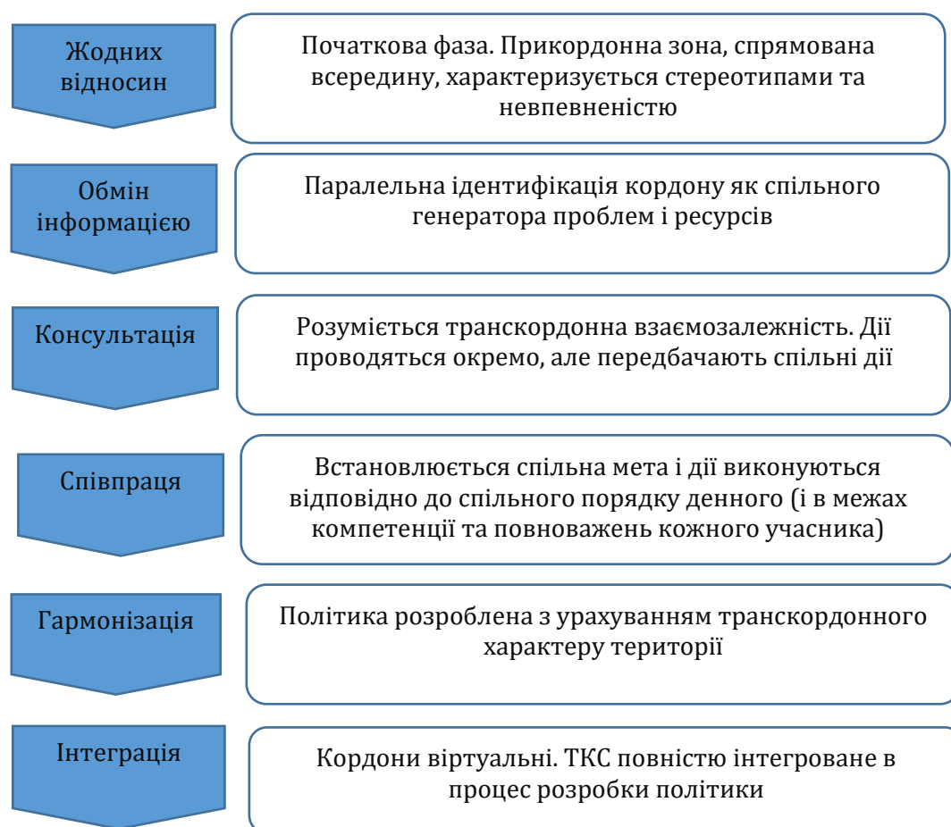
Рис. 1. Етапи транскордонного співробітництва

Транскордонне співробітництво не передбачає надання додаткових повноважень прикордонним громадам чи органам влади, це, радше, ефективний спосіб реалізації повноважень місцевої влади. Однак, це, тим не менш, може допомогти подолати виклики, пов'язані з наявністю кордону, такі як відмінності в законодавстві та інфраструктурі [8].